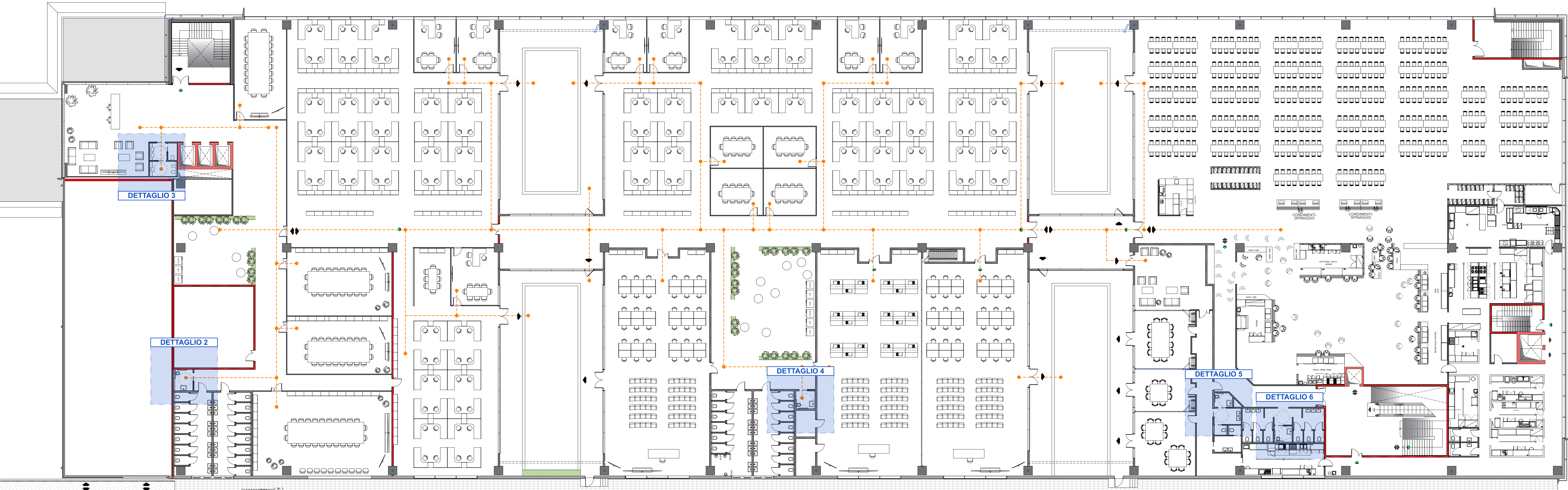
1:200 Q - RAPPORTI ILLUMINANTI PIANO TERRA